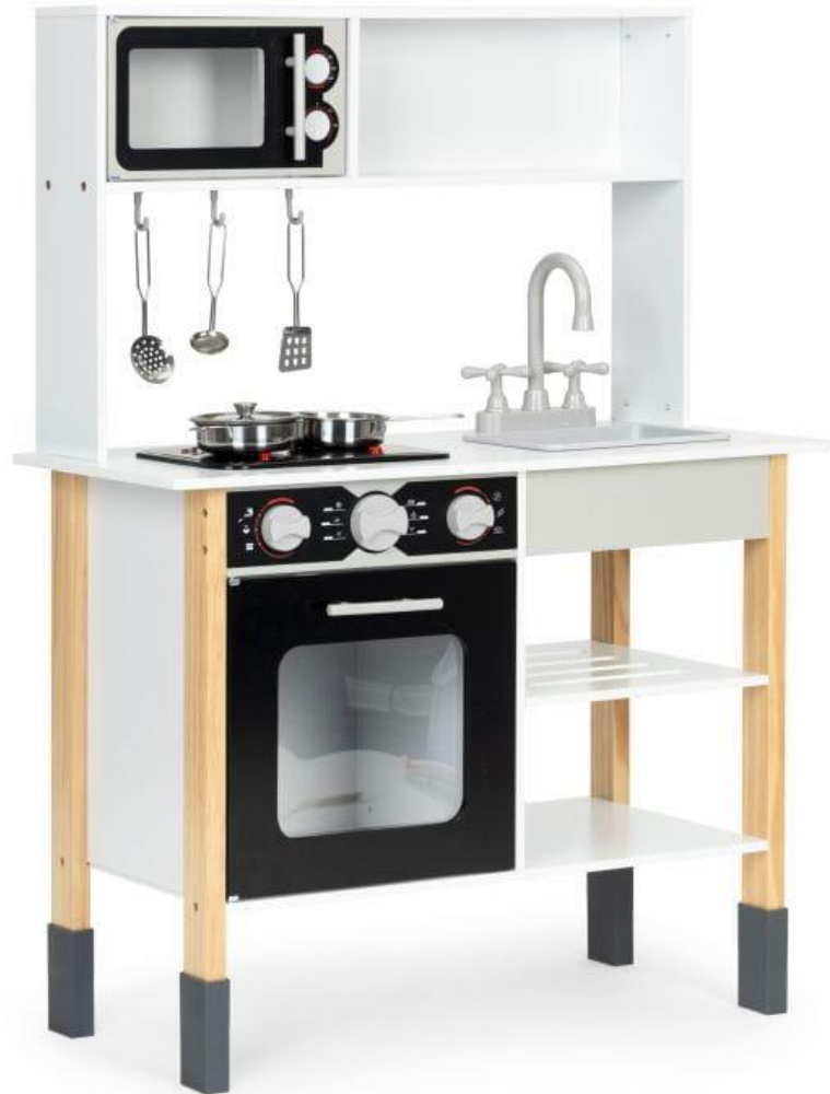
Drewniana kuchnia dla dzieci piekarnik palniki mikrofalowa akcesoria