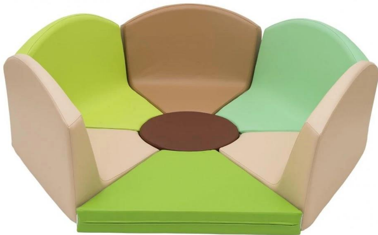
Kącik wypoczynkowy Orchidea