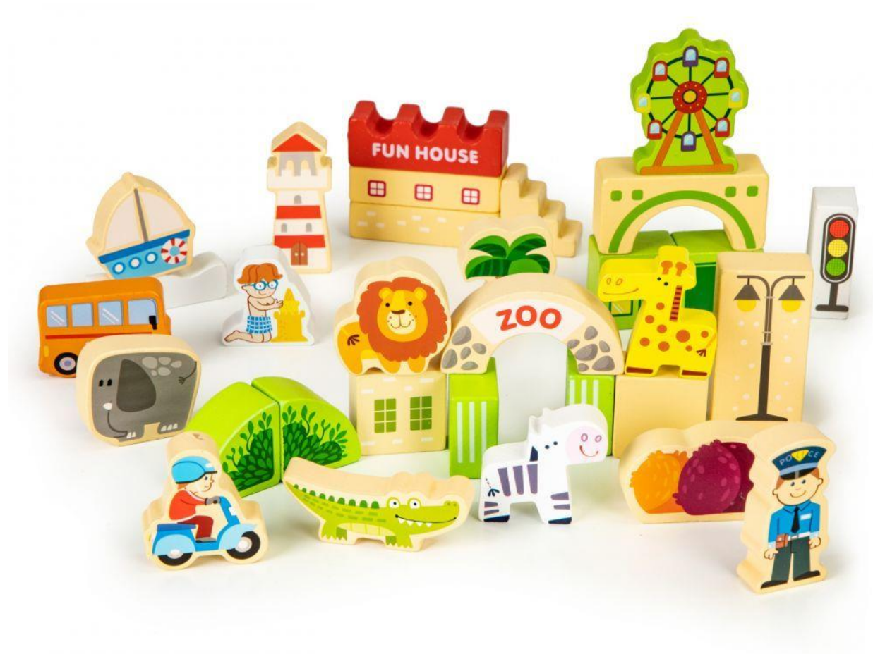
Drewniane klocki edukacyjne miasto ZOO 120 el