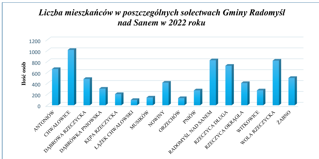
Wykres 2. Liczba mieszkańców w poszczególnych miejscowościach Gminy Radomyśl nad Sanem w 2022 roku