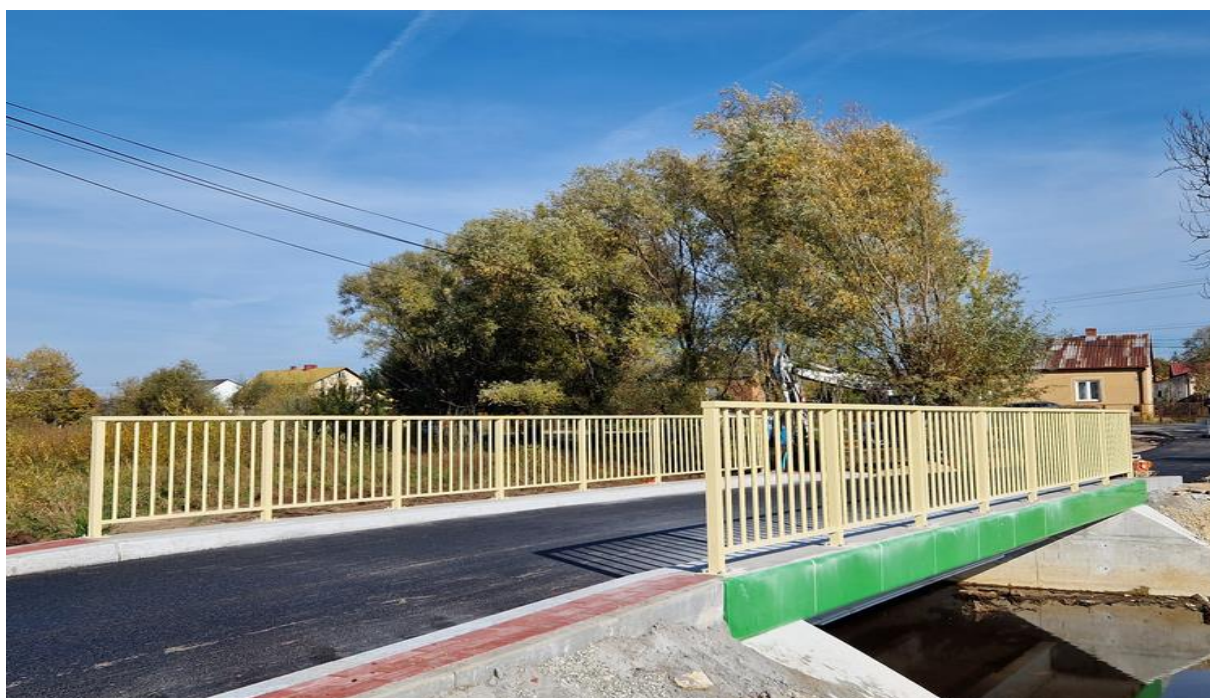
Zdj.3. Wyremontowany most w Rzeczycy Okrągłej [1]

W ostatnim kwartale 2022 roku zakończyła się przebudowa mostu na rzece Łukawica w Rzeczycy Okrągłej wraz z odnową odcinka drogi gminnej na długości 22 m. Koszt wykonanych prac wyniósł blisko 1,4 mln. złotych. Zadanie zrealizowano dzięki dotacji pozyskanej przez Gminę Radomyśl nad Sanem z Funduszu „Polski Ład”, jej ogólna kwota wyniosła 8 mln. zł. Z uzyskanej dotacji, środki w wysokości 2 mln. zł. zostały przeznaczone na zadania drogowe, w tym właśnie przebudowę mostu w Rzeczycy Okrągłej. Wykonawcą inwestycji było Konsorcjum PBI Infrastruktura z Kraśnika.