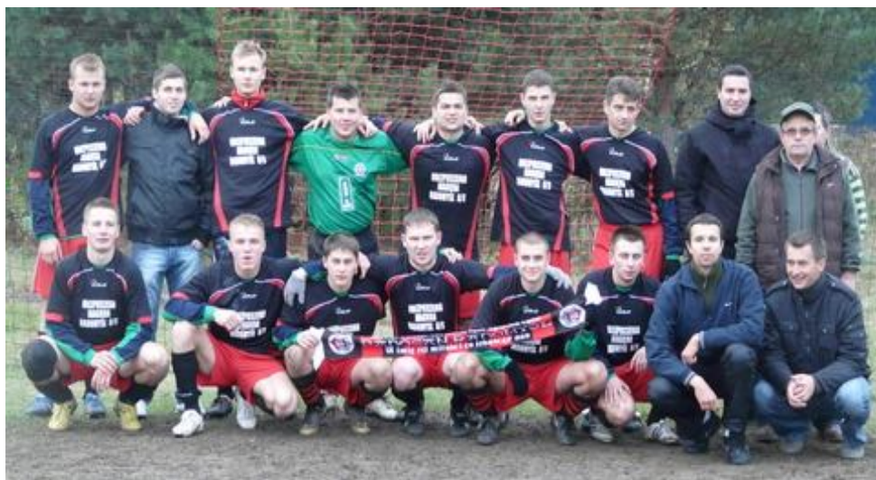
Drużyna piłki nożnej

Historia klubu wiąże się z datą 6 czerwca 2000 r., kiedy to Ludowy Zespół Sportowy Radomyśl został zarejestrowany w Sądzie Okręgowym w Tarnobrzegu. Kadra zespołu liczy 20 zawodników oraz 3 osoby wchodzące w sztab szkoleniowy.