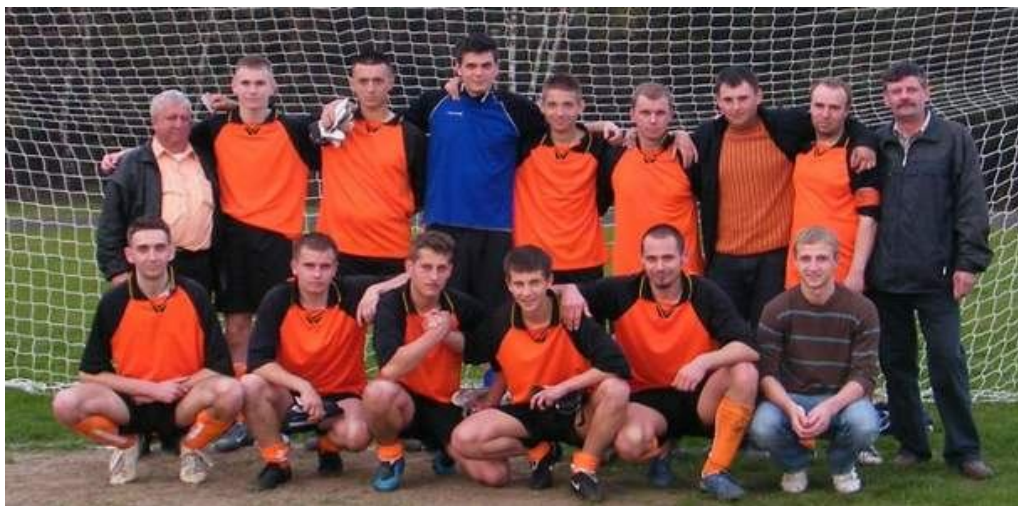
Drużyna piłki nożnej

Obecna kadra seniorów liczy 22 zawodników oraz 3 osoby wchodzące w sztab szkoleniowy.